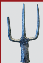
Harce de charpentier et fourche trouvées sur le site de la Bonneville. Monument commémoratif édifié sur le site