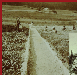
La choulette des plantes médicinales commercialisées par Camille Droz se faisait aussi bien dans les jardins de l'exploitation (à gauche) qu'en pleine nature (dans les pâturages jadis en friche), selon les espèces. La main-d'œuvre affluait à cette tâche et, on le voit, essentiellement féminine. Et avec leurs belles robes, leurs chapeaux et leurs paniers à légumes, elles n'étaient guère différentes des femmes d'aujourd'hui, assésamment, comme le prouvent les quantités ramassées au domaine (en bas à gauche).

En ce 21 e siècle qui connaît un véritable engouement populaire pour l'alimentation, les matières et les thérapies naturelles, les recettes de Camille Droz ont trouvé un regain d'actualité et de nouveaux adeptes parfois inattendus. On les voit, par exemple, volontiers citées par les promoteurs d'une libéralisation de la consommation récréative de cannabis, rappelant que l'herboriste des Geneveys-sur-Coffrane était déjà, voici près d'un siècle, un prescripteur convaincu des propriétés bienfaitantes du chanvre! L'occasion de rappeler que cette plante, l'une des plus anciennes et des plus universelles, était communément cultivée dans nos campagnes pour ses multiples applications. Une culture qui connaît d'ailleurs, un peu partout, un évident renouveau.