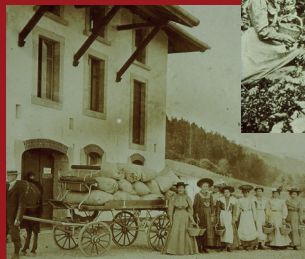
L'herboristerie a subsisté, mais on ne peut plus qu'imaginer le charme du parc d'attractions naturaliste qui l'entourait autrefois!