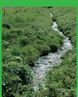
Le bœuf et ses affluents jouent un rôle majeur dans l'écoréseau Val-de-Ruz. Les rizières d'eau sont une des principales sources de développement des populations animales. Préserver ou réhabiliter leurs berges naturelles, en faire aussi des zones qui puissent les accueillir, est une des priorités de ce projet. Au bénéfice aussi de la qualité des eaux et de celles des paysages.

L'écoréseau, ou réseau écologique, est un moyen simple, économique et efficace d'assurer aux espèces animales et végétales des zones d'habitat et des voies de communication suffisantes dans un environnement de plus en plus transformé par les activités humaines. Il consiste à ménager, en bordure et au cœur des zones bâties, cultivées, exploitées, des espaces suffisants en nombre, en surface, en qualité et en diversité, qui gardent leurs caractéristiques naturelles et leur valeur de biotopes. Ainsi de nombreuses espèces animales et végétales, menacées dans leur survie par l'accroissement des surfaces que «dénature» l'activité humaine, retrouvent non seulement des espaces de développement, mais la possibilité, souvent vitale, de se déplacer de l'un à l'autre, en utilisant des «relais naturels» préservés dans les zones inhospitalières pour elles. Comme tout réseau, l'écoréseau est donc voué à l'interconnexion – en l'occurrence celle des espèces vivantes.