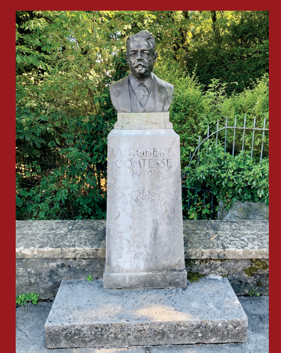
Place de la gare CFF de Neuchâtel

Les Chemins chouettes d'Espace Val-de-Ruz vous font découvrir le patrimoine naturel et culturel de la région au gré de votre curiosité et de vos possibilités. Pour en savoir plus: www.chemins-chouettes.ch