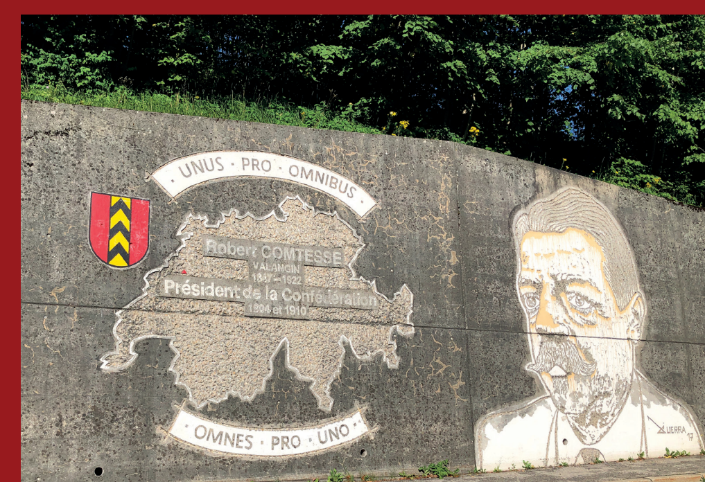
Mur à Valangin – œuvre réalisée au marteau-piqueur et à la peinture par l'artiste Telmo Guerra en 2017.