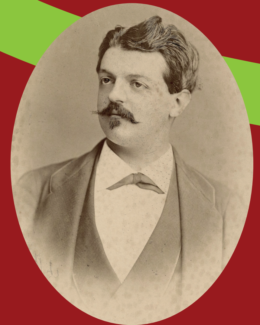
Robert Comtesse vers 1880

Né à Valangin le 24 août 1847, décédé à La Tour-de-Peilz le 17 novembre 1922, il fut un homme politique, avocat et juge suisse. Originaire de La Sagne et bourgeois d'honneur de Cernier et de Neuchâtel, il sera Conseiller fédéral de 1899 à 1912, soit 12 ans, 2 mois et 21 jours.