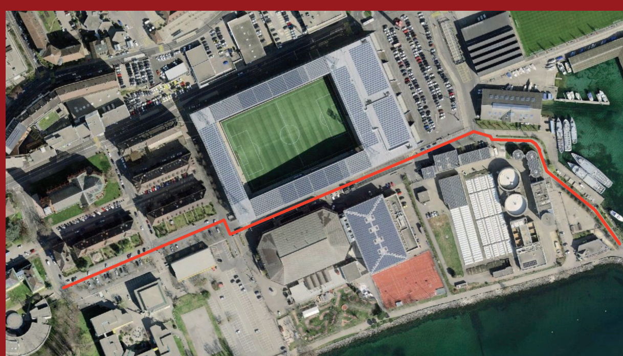
Quai Robert-Comtesse à Neuchâtel (SITN)

Texte d'après Wikipédia et Dictionnaire Historique & Biographique de la Suisse