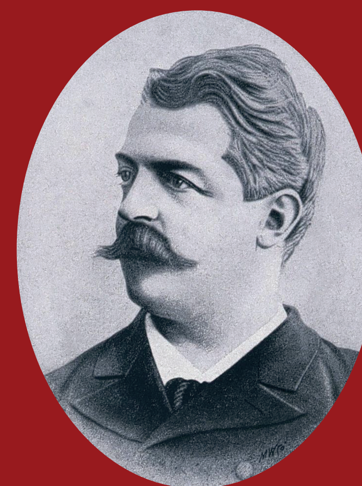
Photogravure publiée à l'occasion de l'élection au Conseil fédéral en 1899, éditée par l'Association patriotique radicale de Neuchâtel-Serrières

Le Quai Robert-Comtesse à Neuchâtel et la Rue Robert-Comtesse à Cernier ont été nommés en son honneur.